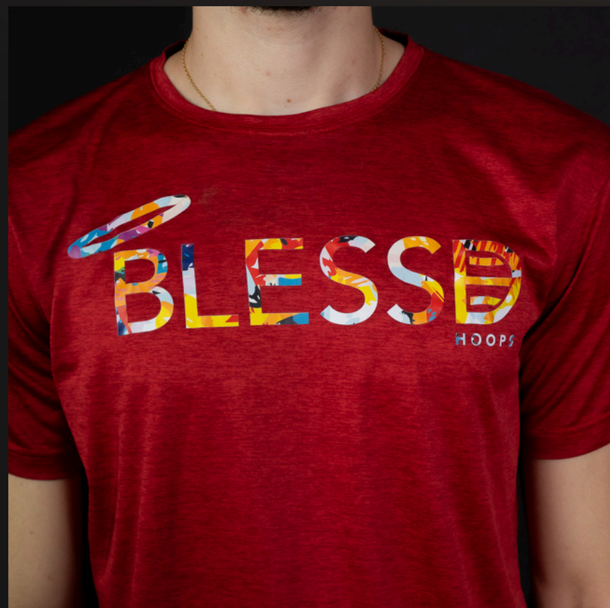
Maillot Blessed Performance