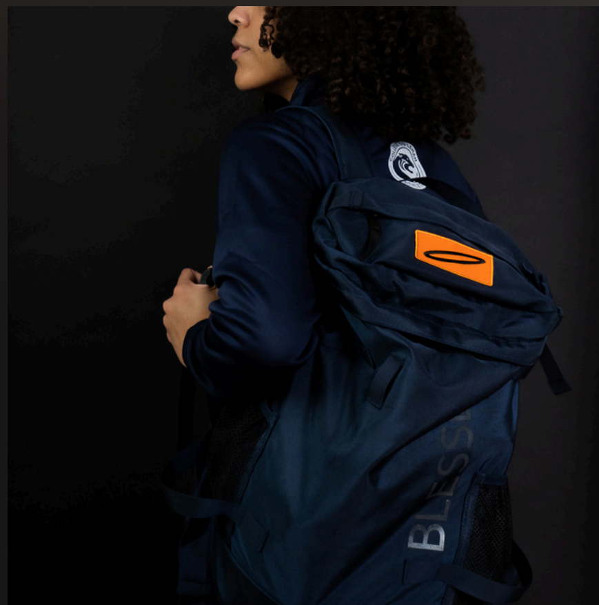
sac à dos