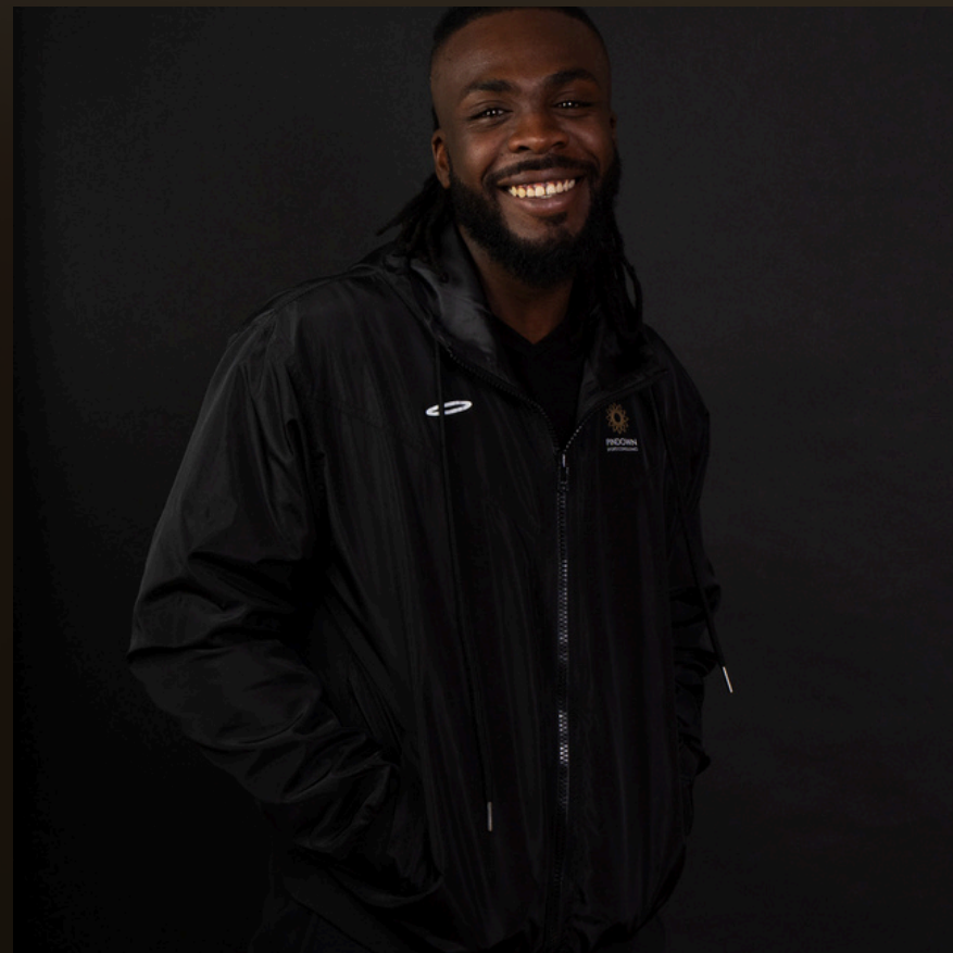
Veste de printemps