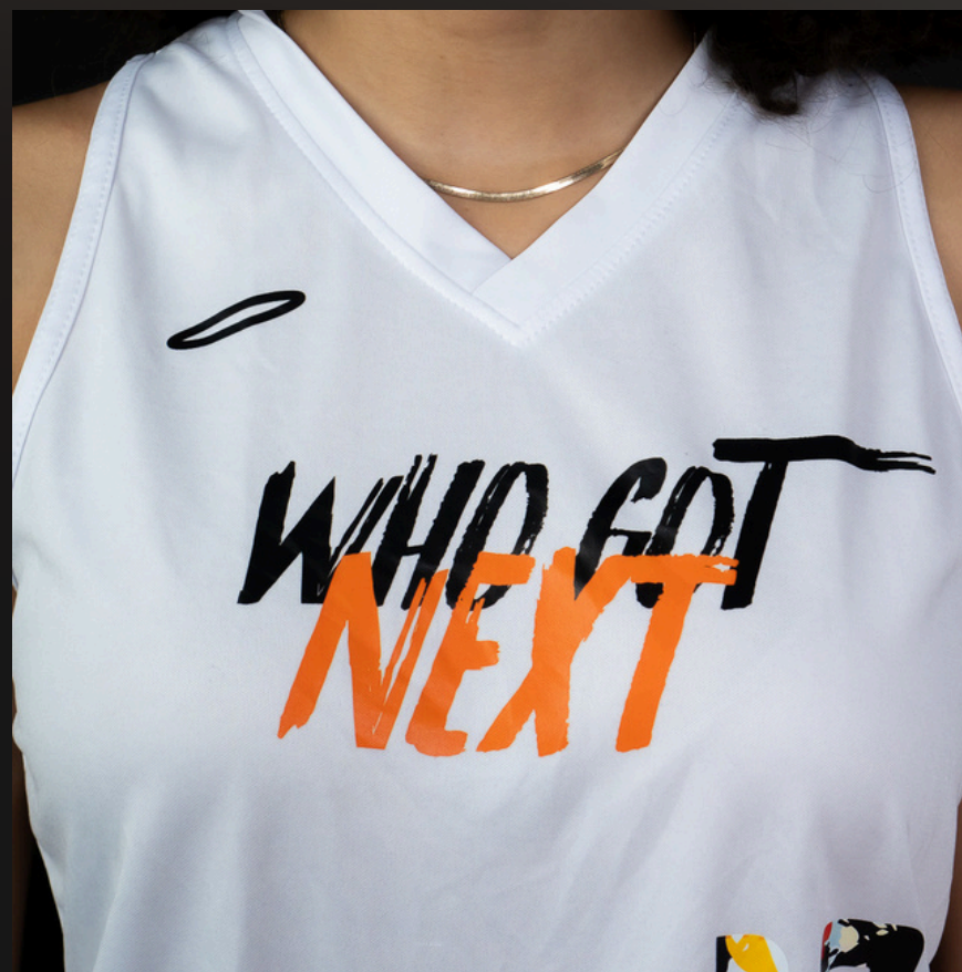
Maillot sans manches